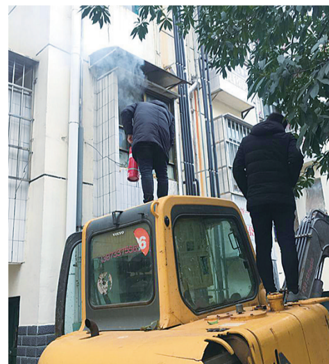
▲志愿消防队员在灭火