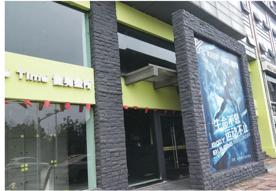
▲昨天上午,位于滨江南路的“Keep Time”健身会所大门紧锁

昨天上午,多位市民拨打晚报新闻热线28829110:我们在“Keep Time”(科普泰姆)健身会所办理了会员卡,但前几天健身会所关门了,老板跑路了,电话一直无法联系上。