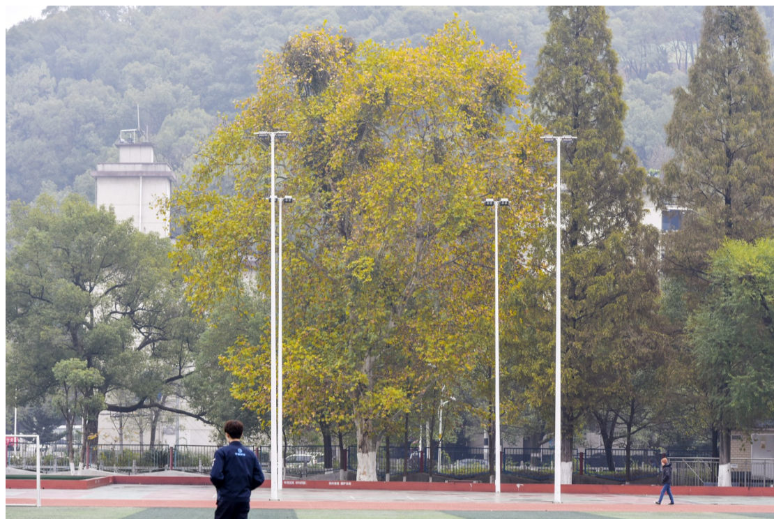
▲11月28日,寒风乍起。芦淞区株董路南方的职工文体中心,大树枝叶变黄