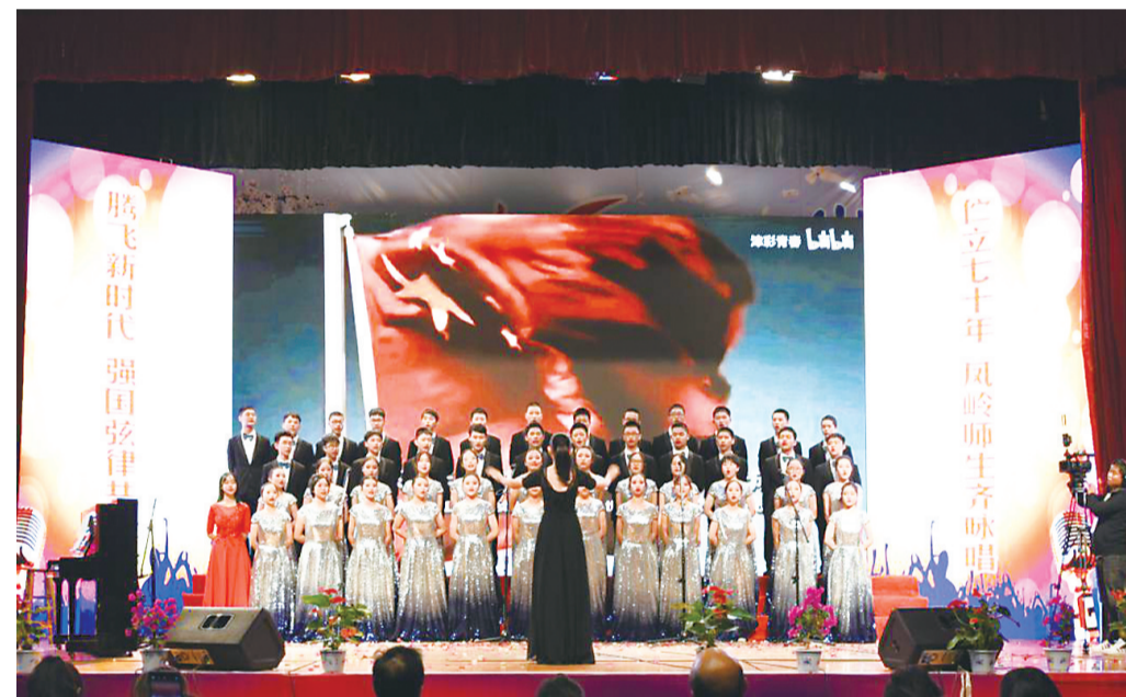
▲1914班带来的节目《没有共产党就没有新中国》

11月18日晚7时,南方中学在学校艺体馆举行以“壮丽七十年·奋斗新时代”为主题的第二十一届合唱节暨“三热爱”歌咏比赛决赛,共15支合唱队参加。同时,特别邀请了株洲市音协主席王明夫等五位专家担任专业评委。