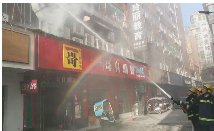
▲餐馆室外油烟管道起火,消防员正在扑救

“时间久了,油污油脂会在管道里积聚,形成一定量后,会在管道壁里形成垢层,一旦厨房火苗过大或火星较多,被抽油烟机强有力地带进油烟管道,就容易引发火灾。”消防员提醒,油烟管道和抽油烟机最好定时清洗,保持清