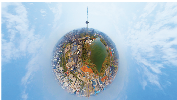
株洲,就是我们最熟悉的小世界。

做为一个北方人,转眼已经来到株洲这个城市将近十年。在这里上班,在这里创业……从陌生到熟悉,在一个城市越久,身上自觉不自觉会有这个城市的印记,也越来越迷恋这片为之奋斗过的土地。摄影人常说今天的记录就是明天的历史,每一次按下镜头的瞬间都是一段城市历史的定格,也是一份记忆的永存。我会一直坚持,用不同的视角去记录这座我热爱的城市。