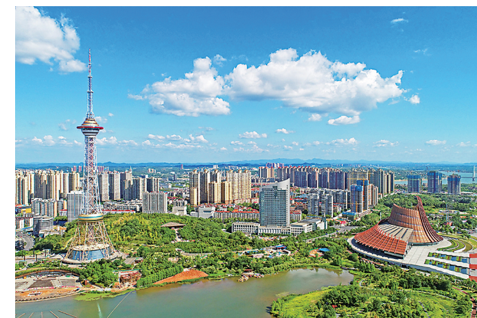
神农福地,动力株洲。