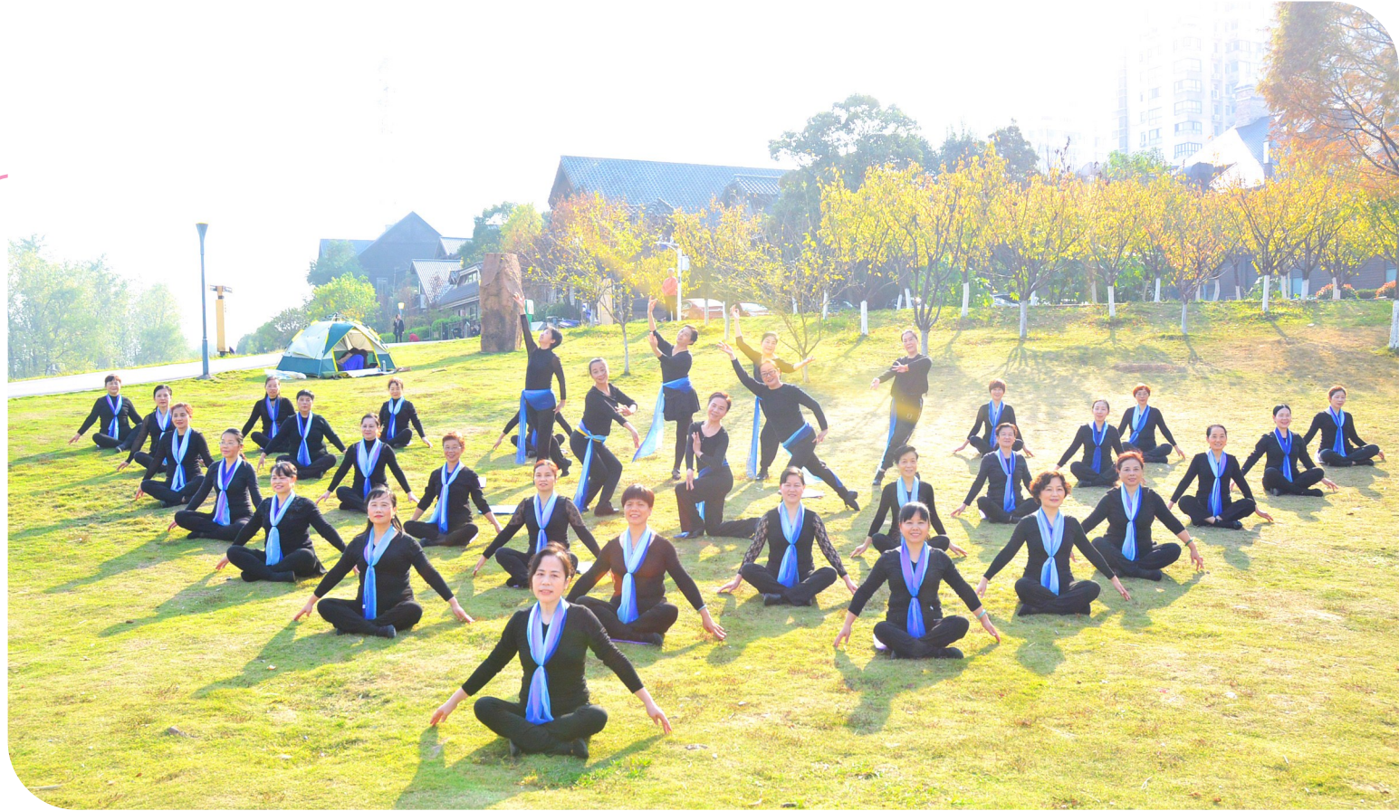
晚报老年大学将课堂搬到了湘江风光带