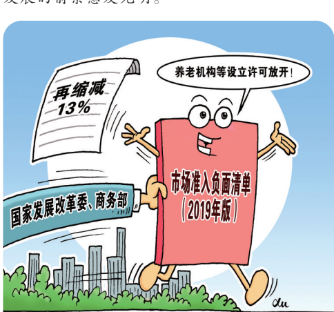
漫画:再缩减 新华社发 徐俊作

从2018年正式全面实施市场准入负面清单制度,到如今首次年度修订,中国沿着激发市场活力、携手世界共赢的方向持续发力,中国开放的大道正在越走越宽,中国经济实现高质量发展的前景愈发光明。