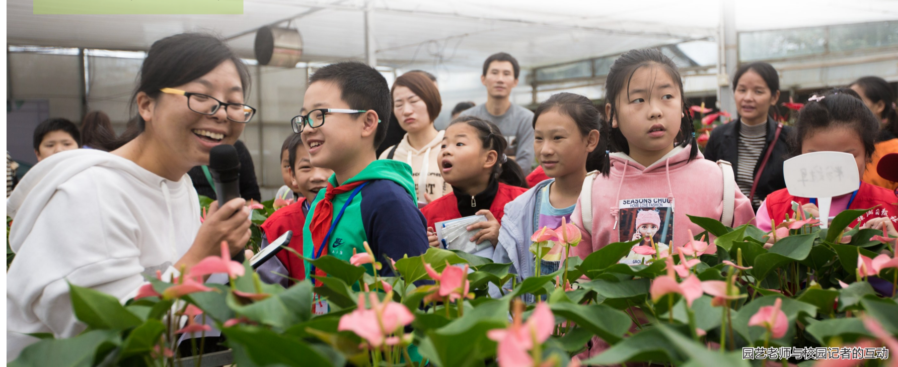
园艺老师与校园记者的互动