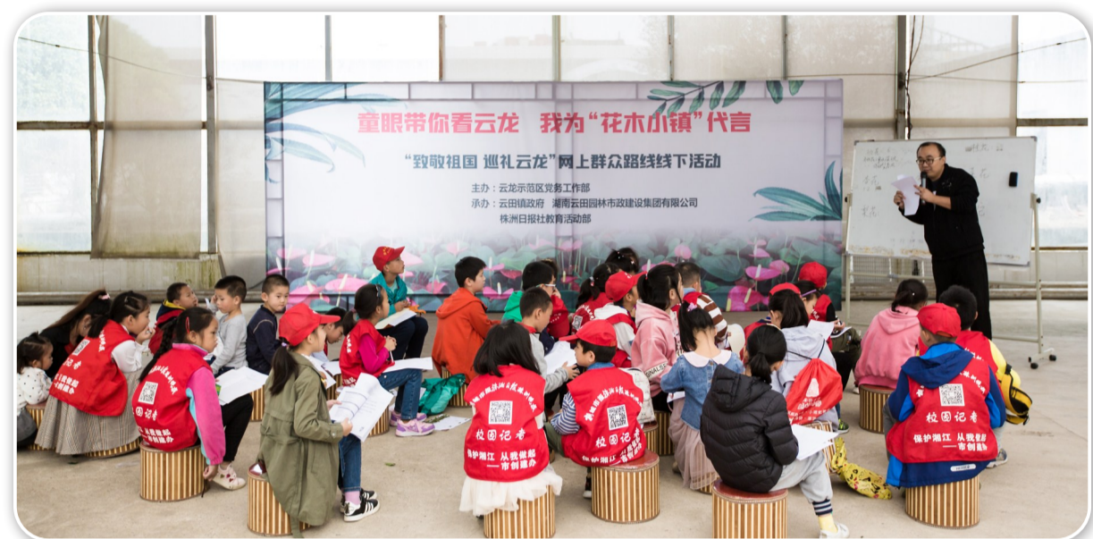
▲古诗词课上,校园记者们认真倾听“飞花令”规则

“这次活动我很开心,看到了好多漂亮的鲜花,还学会了种花的一些技巧,做了树叶贴画,还记住了好几首古诗。以后我要多参加校园记者的活动。”一位三年级的校园记者说。