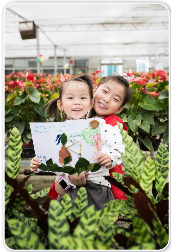
▲校园记者与自己的作品开心合照