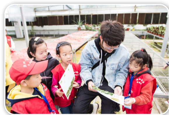
▲谢老师正在点评校园记者们的作品