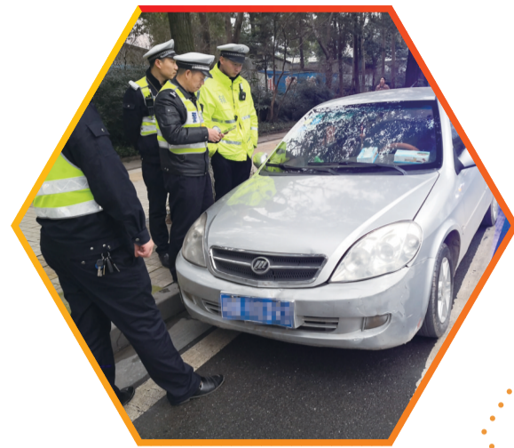
民警运用“掌上E督”进行现场取证。