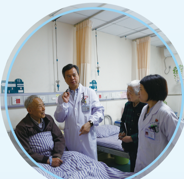
▲ 省肿瘤医院专家查房。