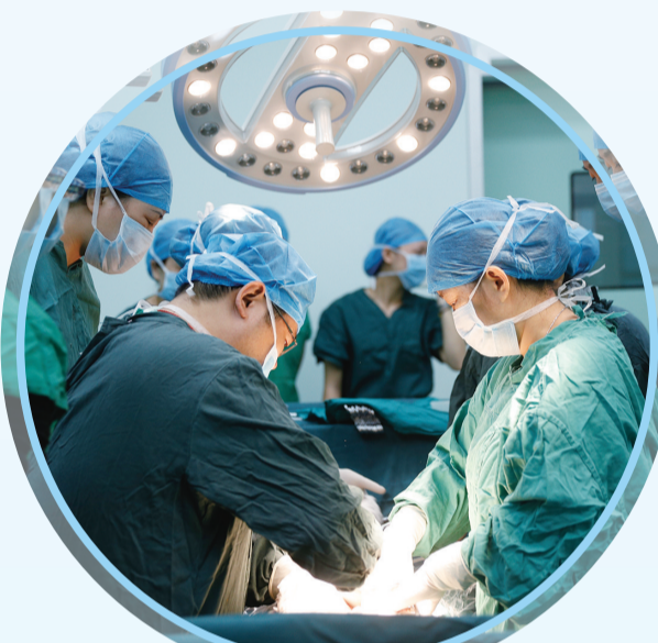
▲ 省肿瘤医院专家来市二医院开展手术。