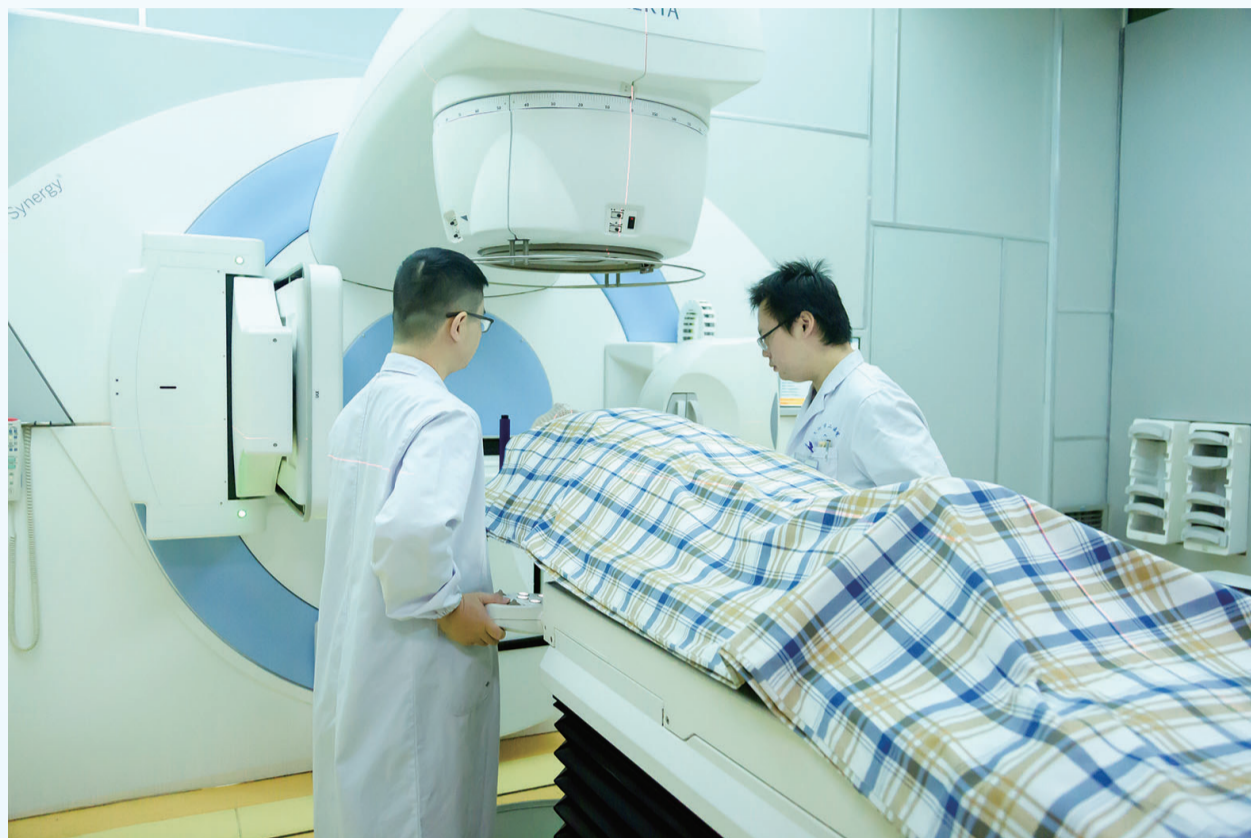
▲ 能够实现当今先进放疗新技术的医科达直线加速器—Synergy。

这是一些令人振奋的变革。2012年6月,株洲市二医院获得市政府同意,整合全市肿瘤资源,建设株洲市肿瘤医院。2018年,该院加入湖南省肿瘤专科医联体。2019年5月,该院成为湖南省肿瘤专科联盟株洲基地,而全省仅有两家医院成为湖南省肿瘤医院的基地医院。这些变革凸现出市二医院满载丰收、阔步向前的风采,展示出该院以肿瘤为重点学科发展的战略思路,折射出它在株洲地区的品牌地位。 “医者,仁也。”这些年,市二医院在践行这份大仁大爱的传承中,为株洲百姓圆健康之梦,为万千肿瘤患者呵护生命之光。