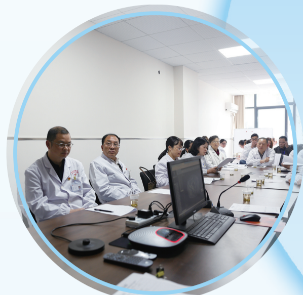
▲ 省肿瘤医院专家在市二医院参与MDT会诊。