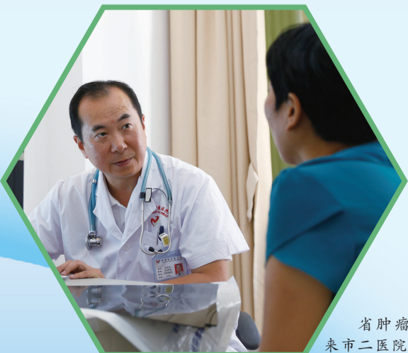
省肿瘤医院专家来市二医院坐诊。

回首过往心潮澎湃,展望未来壮志在怀。新征程,再出发。秉承过往的发展荣光,市二医院将始终保持奔跑之身姿,逐梦前行,抢占肿瘤学科发展高地,为百姓健康保驾护航。