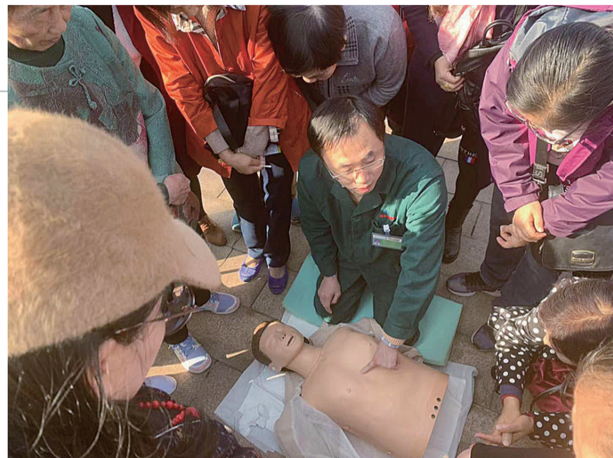
▲医护人员教市民如何寻找心肺复苏的正确位置