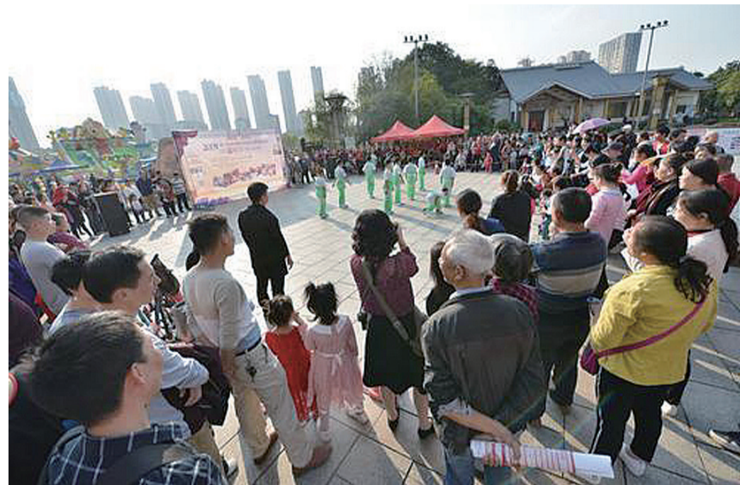
▲去年“社区嘉年华”活动现场(资料图)