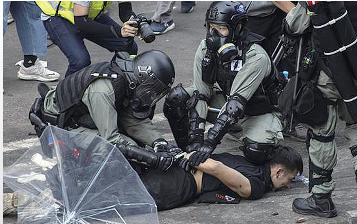
▲香港警方在理大附近拘捕多名暴力示威者

当地时间11月19日,美国国会参议院不顾中国政府的多次强烈反对,通过所谓“2019年香港人权与民主法案”,此举激起中国人民和所有期望香港恢复安宁稳定的人们的极大愤慨,暴露出美方粗暴干涉中国内政、蓄意搞乱香港的险恶用心,再次让世人看清美国一些政客的霸道本性和颠倒黑白的丑恶嘴脸。