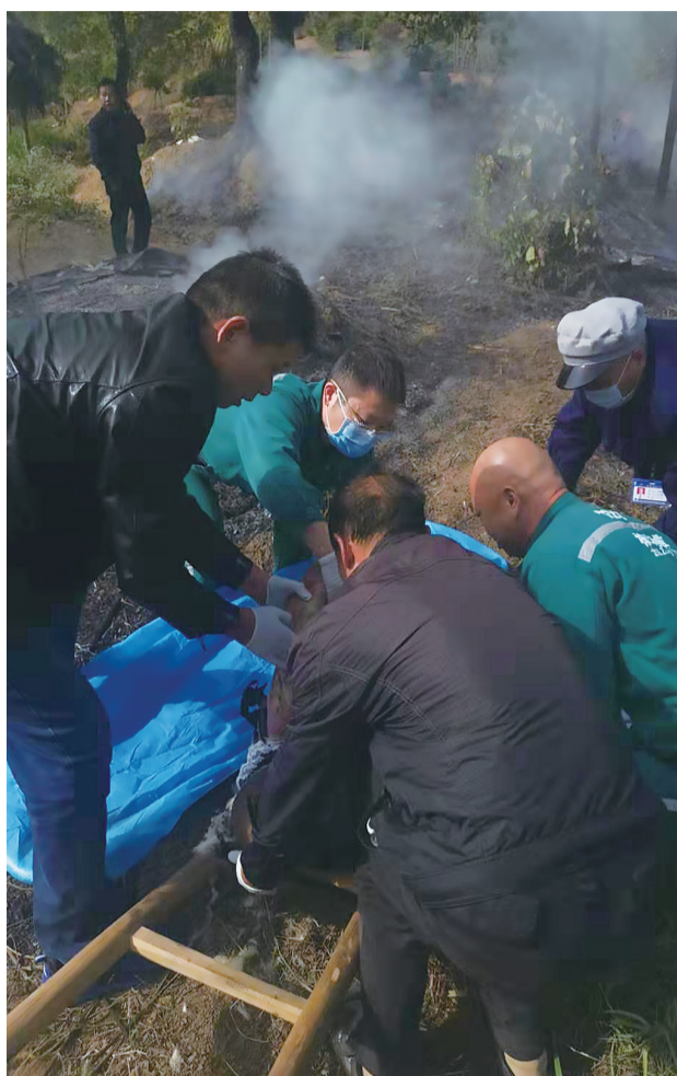
▲公交员工协助医务人员把伤者抬上担架

本报讯(记者 戴凇 通讯员 殷滋)昨日下午,公交清石基地外的小山头上突然冒出浓烟,有人身上着火。公交部门工作人员发现后立即上山救援。