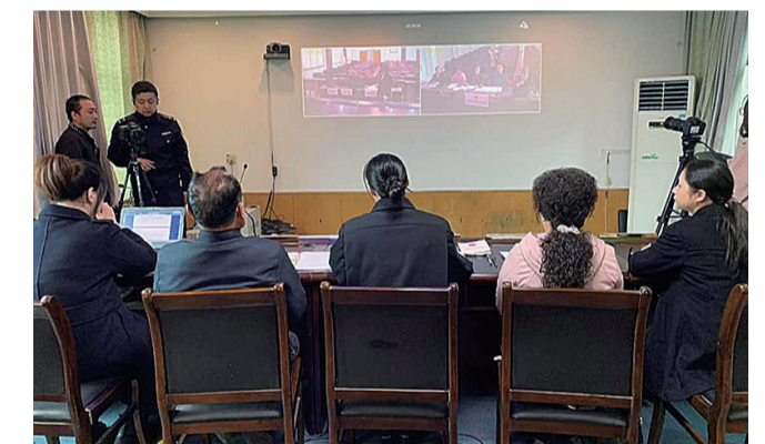
▲芦淞区法院开庭现场,屏幕左侧为醴陵市法院实况,右侧为芦淞区法院实况