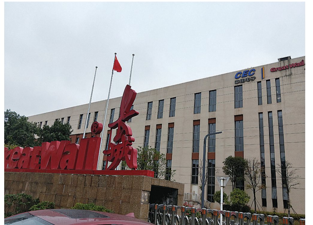
▲湖南长城计算机系统有限公司外景