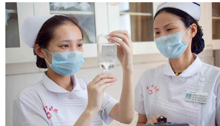
▲省直中医院的护士在做打针前的准备

家里有病人不方便去医院,但又需要专业的护理?今后,遇到类似的情况无需再发愁。因为,“网约护士”来啦!患者用手机下单即可呼叫护士到家中提供服务。