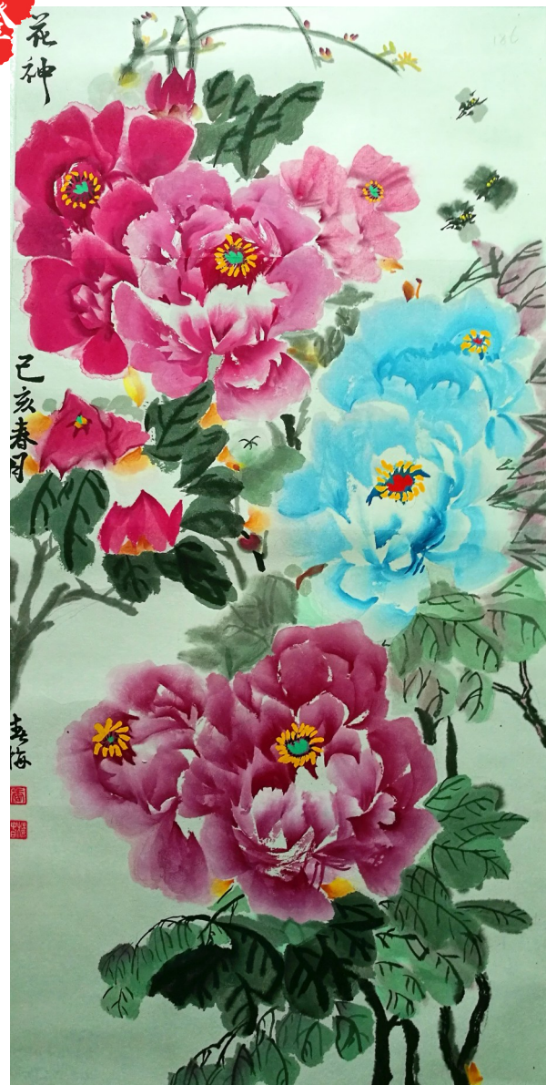
唯有牡丹真国色。(作者:唐春梅 62岁 石峰区三中宿舍区)