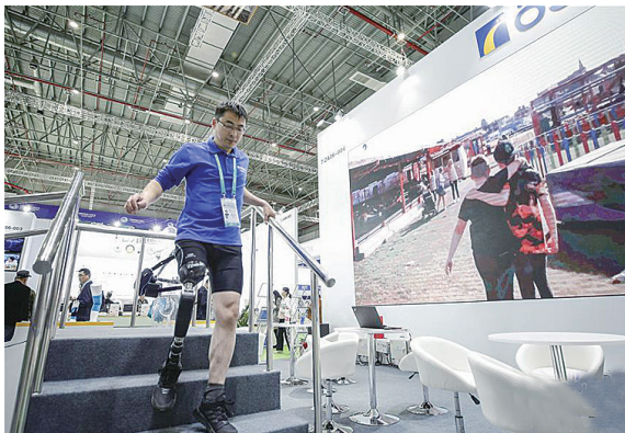
▲工作人员展示“仿生磁控膝关节”