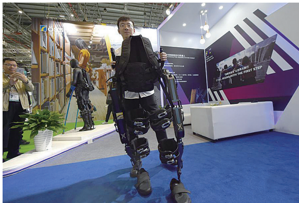
▲工作人员体验一款外骨骼康复步行机器人