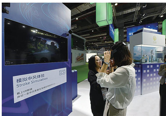
▲参观者使用VR设备模拟中风体验

有专家建议,政府相关部门不妨牵头,在“十四五”期间成立康复器具产业引导基金,凝聚各方之力,帮助康复器具创业企业引进、消化、吸收,生产出更多有品质、有温度的康复器具。(摘自新华网)