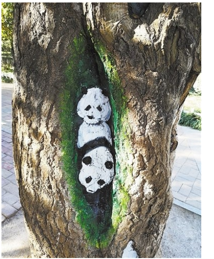
别有“洞”天,青岛文化公园把树洞当画布。