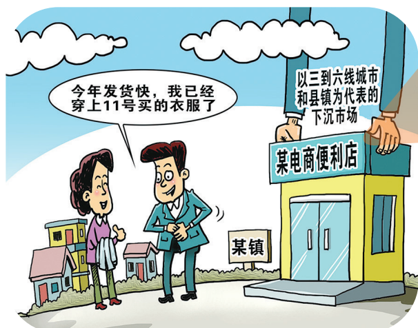
漫画:下沉市场 新华社发 朱慧卿 作