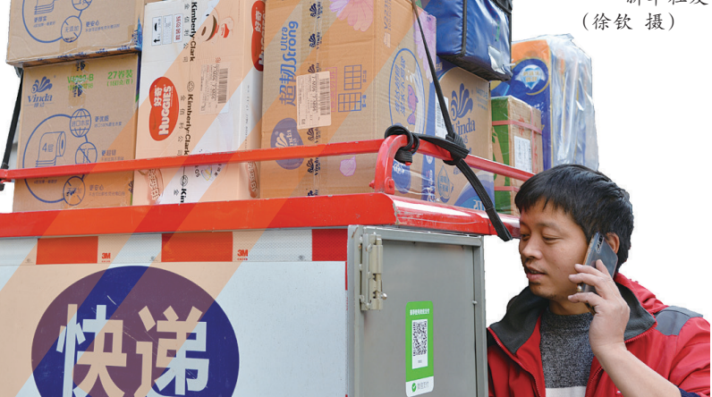
一名快递员准备送货上门。

本报综合消息 11月13日浙商总会会长马云表示,今年天猫“双11”的GMV超过预期,也大大超出了大家对当前经济形势的预判,不过网上有说法认为,今年“双11”的数据造假,“在这里我向大家保证,在数据时代、在互联网时代,每一分钱都极其之准确。”尽管数据喜人,但马云说,还是有很多原因让他对今年“双11”的成绩不够满意,比如受天气因素影响,一些滑雪服等冬装销量还不大好,另外由于今年“双11”恰逢周一,很多网友第二天还要早起上班,没有办法像往年一样熬夜“剁手”,“希望未来‘双11’国家也能给放半天假”。