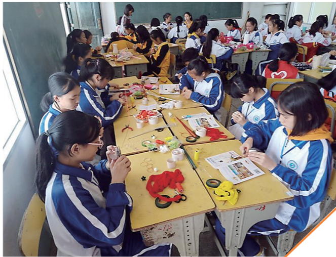
体育路中学第十四届校园科技节活动现场。