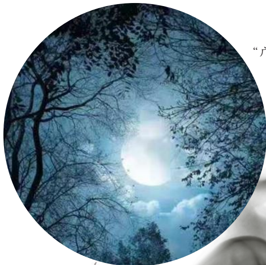
山关八景之“广寒夜月”