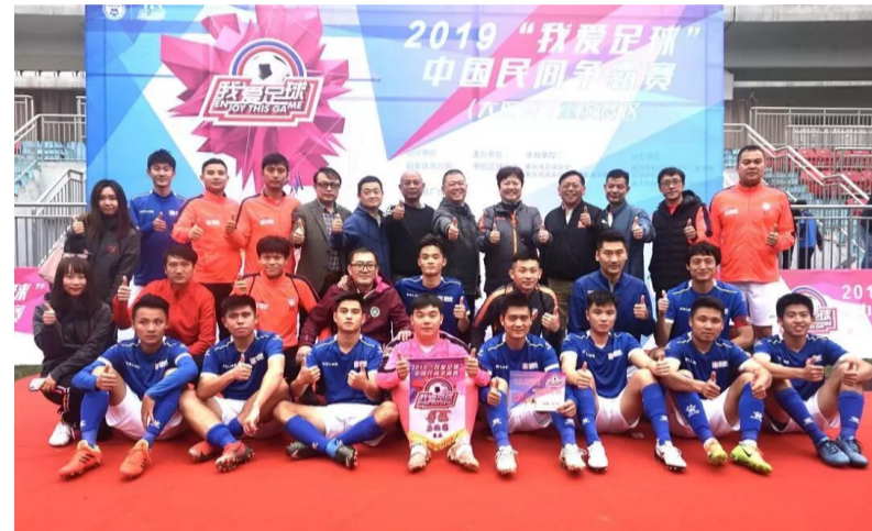
▲我省晋级全国总决赛队伍的部分球员合影

本报讯(记者 肖蓉 通讯员 周潭清)11月9日至11日,2019“我爱足球”中国民间争霸赛(南二区)大区赛在重庆举行。湖南代表队共有3支队伍晋级全国总决赛,其中两支队伍来自株洲。