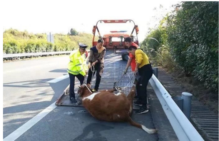
▲路政员和交警帮着车主将黄牛拖上货车

本报讯(记者 刘玺 通讯员 赵雅静)前日,武深高速炎陵段,一头300斤的黄牛从货车上“越狱”,过往车辆纷纷刹车避让。之后,高速路政和高速交警赶紧捉拿,经过3小时“搏斗”,终于将黄牛“逮捕归案”。