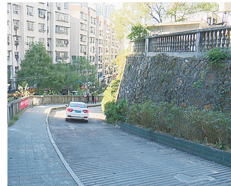
▲拐角的视野盲区,车辆减速慢行