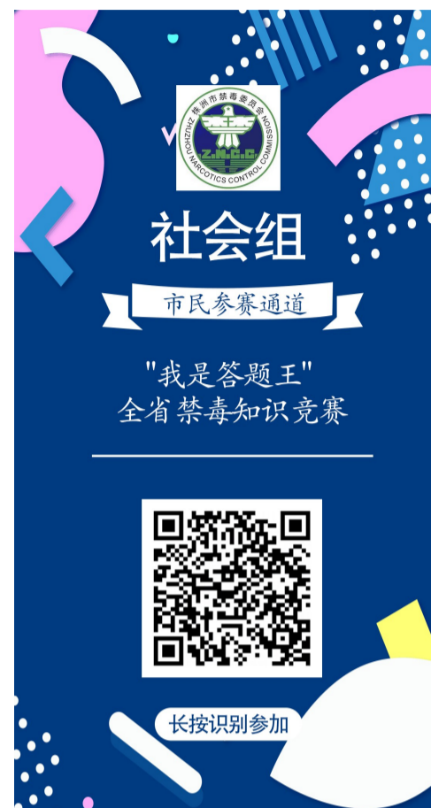
▲扫码进入本次禁毒活动

没有红包,没有抽奖。一周内,100多万株洲人踊跃参与一场禁毒活动。在这场湖南省年度参与人数最多的品牌禁毒活动中,株洲在一周内冲到了全省第一。 一个看似不可能完成的任务,一个没有人敢去想象的奇迹,正在上演。 互联网+政务,究竟是个什么模式?互联网+大数据+政务宣传,究竟能玩出什么花样?