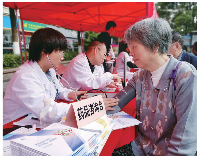
▲市民正在接受义诊