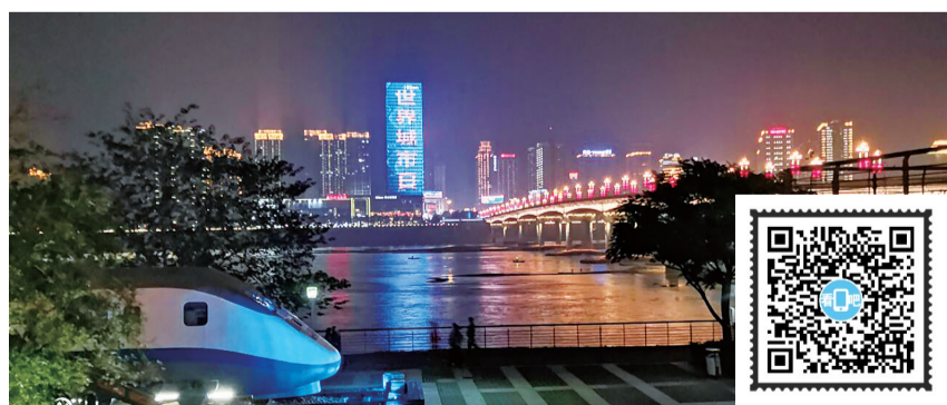
美丽夜株洲。