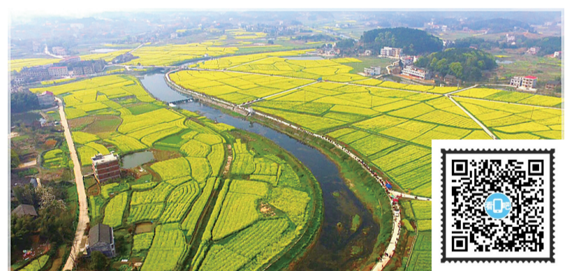
美丽的三门镇。

三门镇,因境内响水村有石岩洞三座,状似三门而得名。三门镇地处天元区,濒临湘江,有一千余年历史。这里市面繁荣,商业发达,尤以粮食贩运和加工业为甚,是湘江之滨的一个大集市。而今,京广铁路隔江