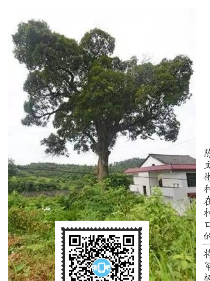
陈文彬种在村口的“将军树”。

在茶陵县腰陂镇布庄村村口,有一棵苦楝树。这棵树是湖南茶陵籍烈士陈文彬参军前种下的,为了纪念他,村里又把这棵苦楝树唤作“将军树”。陈文彬(1911-1940),湖南省茶陵县人,出生于一户贫苦农家,1930年加入中国共产党。抗日战争爆发后,陈文彬任津南抗日自卫军政委,多次沉痛打击日寇。1940年2月,陈文彬率部在河北广平县张孟村一带与日伪军连续激战,在击退敌人7次进攻后不幸遭到敌机扫射,头部中弹牺牲,时年29岁。2014年9月,陈文彬名列第一批300名著名抗日英烈和英雄群体名录。