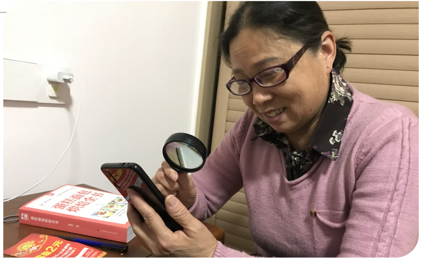
老年人网购大数据