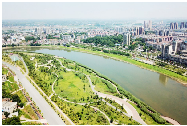
▲渌口区渌江风光带