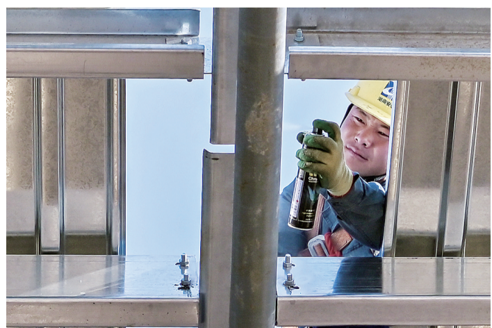
图为湖南安装的员工在该项目现场专注地进行喷涂银粉漆作业。

湖南工业设备安装有限公司承建的上汽大众汽车有限公司MEB工厂标段二工程总建筑面积约78万平方米,分为注蜡车间、能源中心、水泵房、车体