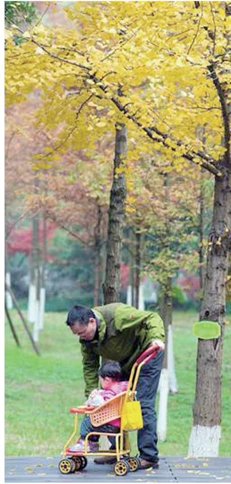
摄影类一等奖:拍摄/王丁