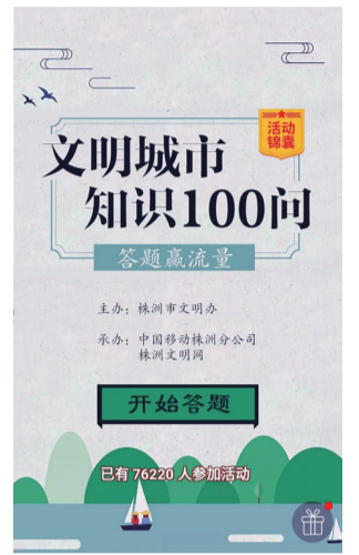
文明城市知识100问H5(截图)

此外,记者还了解到,株洲市委宣传部、株洲市文明办发布了《文明城市创建知识问答》的手册,手册分为“创建篇”“市情篇”“常识篇”