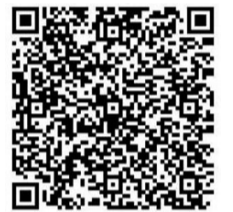
扫描二维码,开始答题。

“践行篇”“成效篇”五个篇章,精选了文明城市创建100个问答,详细地阐释了株洲市文明城市创建过程、创建举措、创建实效等。市民也可以通过手册,学习文明城市创建相关知识,投身建设新时代全国文明城市更高水平全国文明城市工作中来,为文明城市创建贡献自己的一份力量。