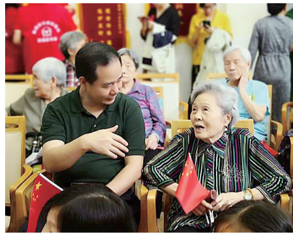
摄影类一等奖:拍摄/唐勇