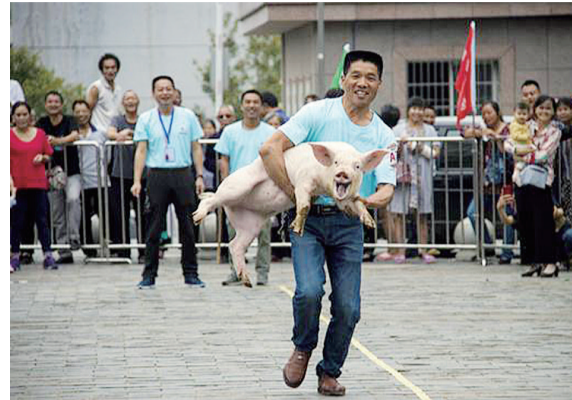
摄影类特等奖:《高塘人的幸福生活之新农民运动会》