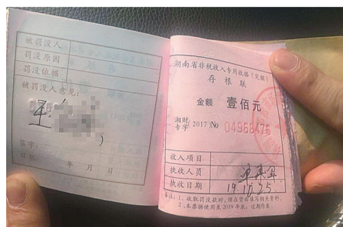
▲王先生抽烟被罚款,留底的收据