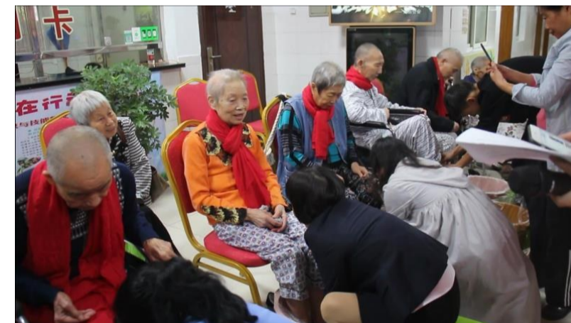
▲老人们正在享受护士的贴心服务

11月1日,国家卫生健康委在北京召开专题新闻发布会,介绍《关于建立完善老年健康服务体系的指导意见》的有关情况。我国老年人健康状况不容乐观,2018年我国人均预期寿命为77岁,但据研究,我国人均健康预期寿命仅为68.7岁。患有一种以上慢性病的老年人比例高达75%,失能和部分失能老年人超过4000万,老年人对健康服务的需求非常迫切。