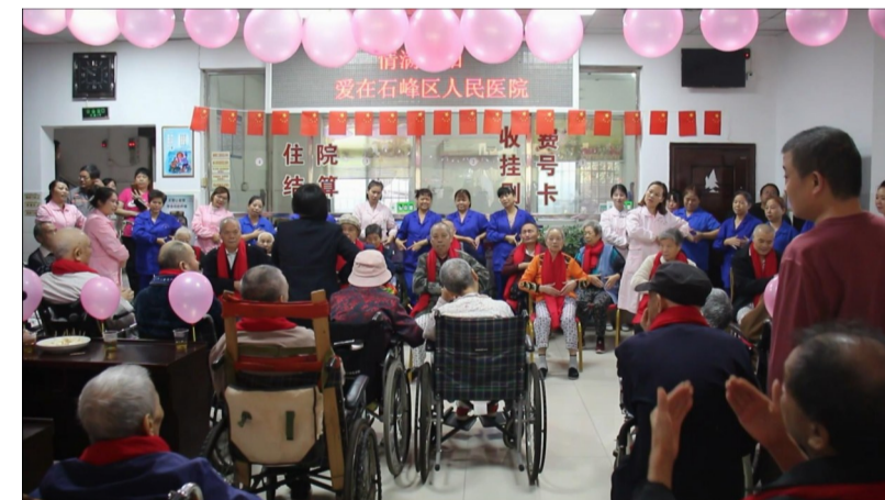
▲今年重阳节,医院为老人们举行了大型庆祝表演