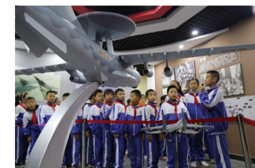
▲学生解说员在讲解人防知识