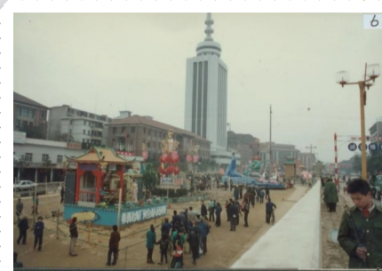
▲电信大楼旧貌(资料图)

《70年70城:株洲》网页链接地址:https://mp.weixin.qq.com/s/wszBW7Yh1wvFVw_G_X-5w)