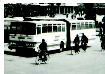
▲株洲公共交通旧影(资料图)