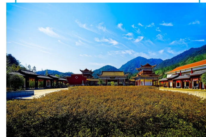
▲茶陵云阳山景区外景

我心底里回味着云阳山的美景,无法一一说出当时的感受,还是借用一句话来评说:读云阳山,远读其壮美,近读其清幽,精读其神奇,细读其深沉。