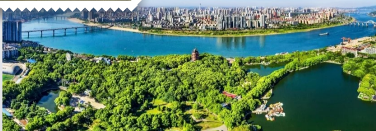
▲株洲新貌