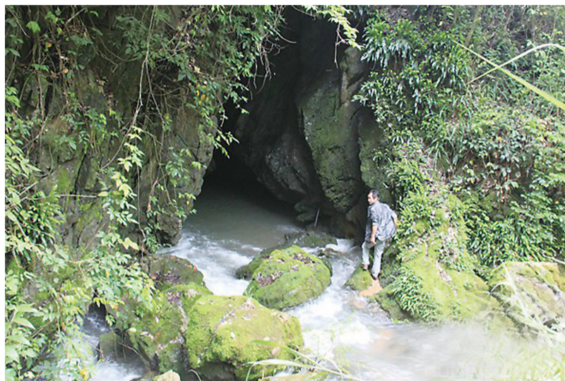
▲秦人洞东入口