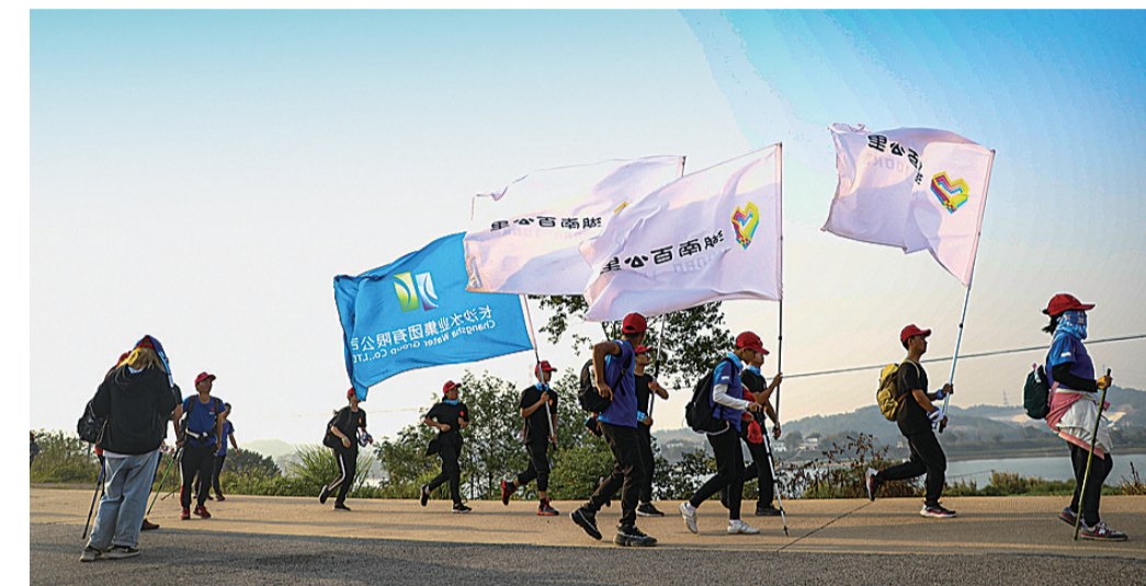
▲11月2日至3日,2019湖南(秋季)百公里活动在长沙、湘潭、株洲三城接力举行

本报讯(记者 李卉 通讯员 阎俊)11月2日至3日,2019湖南(秋季)百公里活动在长沙、湘潭、株洲三城隆重接力举行。