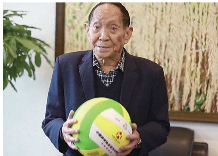
▲袁隆平院士通过视频送来祝福并亲自为本次大赛开球(视频截图)

本报讯(记者 肖蓉 通讯员 周潭清)你知道吗?袁隆平院士除了是共和国荣誉勋章获得者、杂交水稻之父外,还是湖南省排球协会名誉主席。11月2日,株洲清投·2019年全国超级杯气排球联赛总决赛在我市开幕,就是由袁隆平亲自开球,吸引了全国关注。