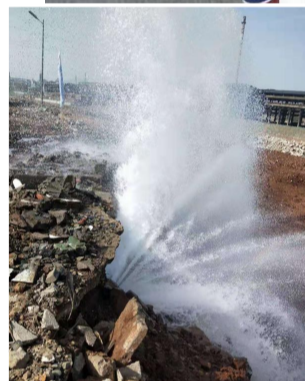
▲自来水管破裂后,自来水大量喷出

“阿姨,你莫出门了,我给你提桶水过来……”昨日下午,石峰区铜塘湾街道杨梅塘社区建材小区突然停水。为保障居民生活用水,经网格员系统调度,洒水车开进居民小区送水,由于居民大多为老人,工作人员贴心地将一桶桶水送到居民家中。