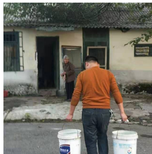
▲工作人员送水到老人家中