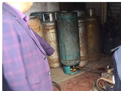
▲气罐设备连在倒放的气罐上

本报讯(记者 刘玺)集市附近,男子租下民房用于非法倒灌、运输、存储瓶装液化气,一旦发生爆炸后果不堪设想。昨日,这处“黑气站”被沅口区多部门查处。