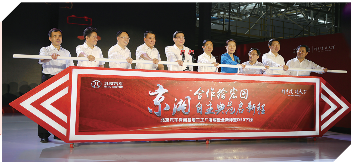
京湘合作绘宏图,自主典范启新程。

逐梦新时代、奋战最强音。未来,北汽集团将与湖南省、株洲市携手同行,以前瞻意识擘画株洲基地新未来。一个“制造基地”开始向着“汽车产业园”的宏伟目标进发。