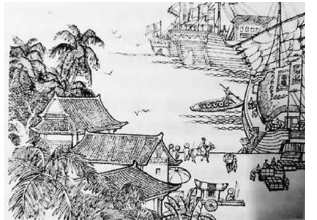
2019年10月19日 星期六 电话:28823906 责任编辑:罗玉珍 美术编辑:赵强 校对:马晴春

张骞一行,出行时一百多人,十三年之后归来,只剩下两人,此次远征付出了很大的代价,虽然张骞联合大月氏共抗匈奴的任务并没有完成,但是却实现了自秦始皇筑长城以来西域与内陆文化的首次碰撞。中国与中亚乃至西