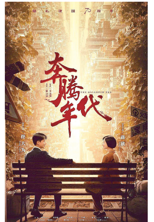
电视剧《奔腾年代》剧照片花