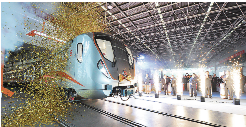
十八号线全自动最高等级无人驾驶列车，昨日在中车株机下线。