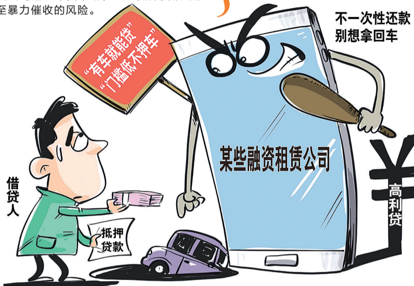
漫画:车贷陷阱 新华社发 王鹏作

——设置苛刻的逾期责任。今年5月,内蒙古自治区人民检察院通报的一例案件显示,被告人针对抵押机动车客户故意设置各种陷阱,在借贷过程中提供格式合同霸王条款,让被害人承担苛刻的逾期责任。同时,被告人使用备用钥匙私自开走被害人车辆,迫使被害人支付高额“违约金”“拖车费”。