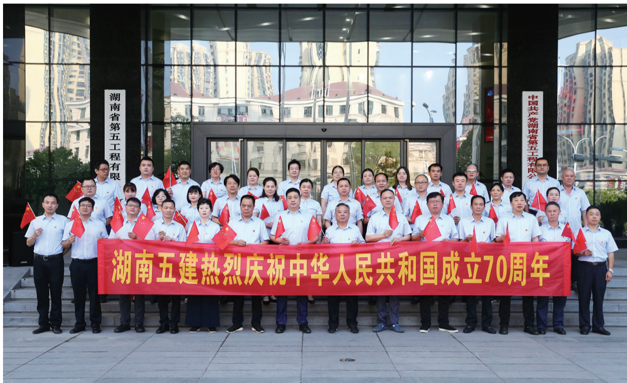
湖南五建热烈庆祝中华人民共和国成立70周年。

湖南五建的答案是：向全国发展的大格局靠拢，主动跟上建筑业转型升级的节拍，自力更生，以党建为引领，坚持创新驱动、质量优先，坚定不移走高质量发展之路。