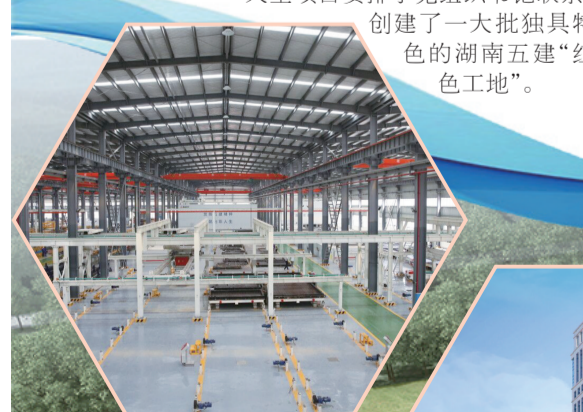
装配式建筑产业基地车间

为强化党在国有企业中的领导地位，湖南五建从顶层设计入手，将党建工作要求写入《章程》，明确党组织在企业法人治理结构中的法定地位。凡属“三重一大”决策事项，均通过召开党委会前置研究把关，严格按照法定程序决策，确保了发展的正确方向。通过开展“党组织书记联项目”“书记讲党课”“党员先锋行”活动，有40多个重点项目、大型项目安排了党组织书记联系，创建了一大批独具特色的湖南五建“红色工地”。