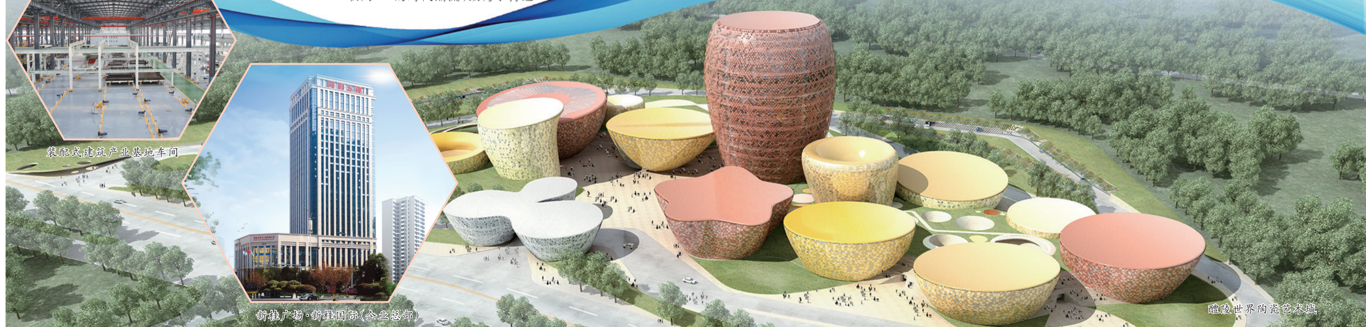
融进世界的特色新城