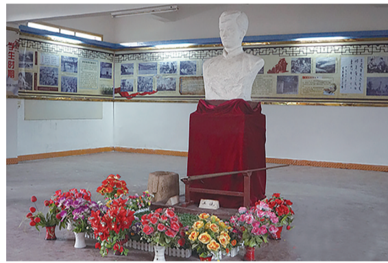
位于攸县凉江小学内的蔡会文烈士纪念馆。

蔡会文(1908-1936),湖南省攸县人,曾任红三军政委、湘赣省军区总指挥兼政委并兼红八军政委、中共湘赣省委委员、赣南省军区司令员等职。蔡会文出生于攸县一个封建地主家庭,父亲是当地首富,在锦衣玉食中长大的蔡会文,却对穷苦百姓更有感情。1925年,蔡会文发动当地群众成立农民协会,号召大家团结起来打土豪、分田地,还带头打开自家粮仓开仓分粮。1927年,他参加秋收起义,跟随毛泽东同志来到井冈山,参与井冈山革命根据地的创建。凭着对共产主义坚定不移的信念,蔡会文先后在中央苏区和湘赣苏区胜利完成了历次反“围剿”任务,在中央红军第五次反“围剿”失败后,他组织开辟湘粤赣边游击根据地,坚持开展游击战争。1936年春,蔡会文带领游击队与粤敌余汉谋部激战,由于敌我悬殊,蔡会文不幸中弹被捕,被敌人割断喉管,壮烈牺牲,年仅28岁。(文/唐剑华 视频/株洲广电)