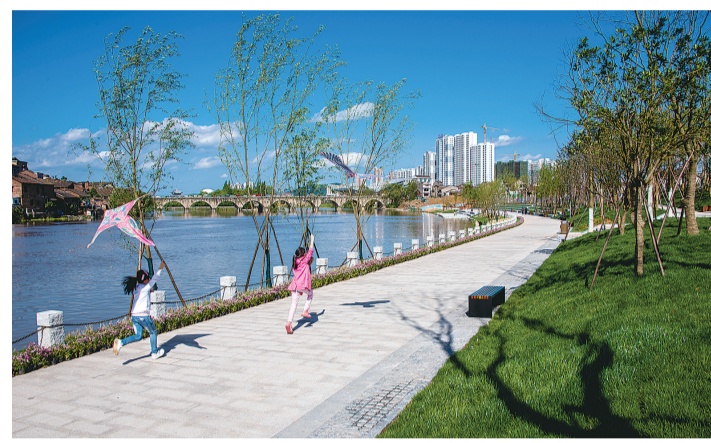
春意盎然的醴陵一江两岸一角。