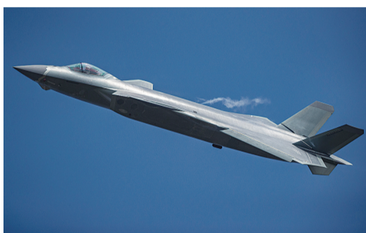
▲空军歼-20战机进行实战化训练(资料照片)

申进科表示,这几年,“空军发布”的声音和歼-20战机的航迹紧密相连。从2016年10月28日首次发布“空军试飞员将驾歼-20飞机亮相中国航展”的消息后,还陆续发布了“歼-20战机组列装空军作战部队”“空军歼-20战机首次开展海上方向实战化训练”等消息,从单机展翅到七机编队,是长空铸剑的航迹,更是强国兴军的航迹。一道道壮阔航迹画出一个同心圆:歼-20志存高远,歼-20走近民众。