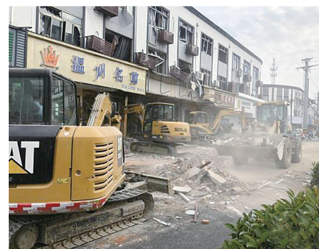
▲挖机和铲车正在清理爆炸现场

据无锡市人民政府新闻办公室官方微博消息,13日上午11时许,无锡市锡山区鹅湖镇新杨路一小吃店发生燃气爆炸。至17时,救援工作结束。经搜救清理,事故共造成9人死亡、10人受伤,目前伤员伤势稳定。