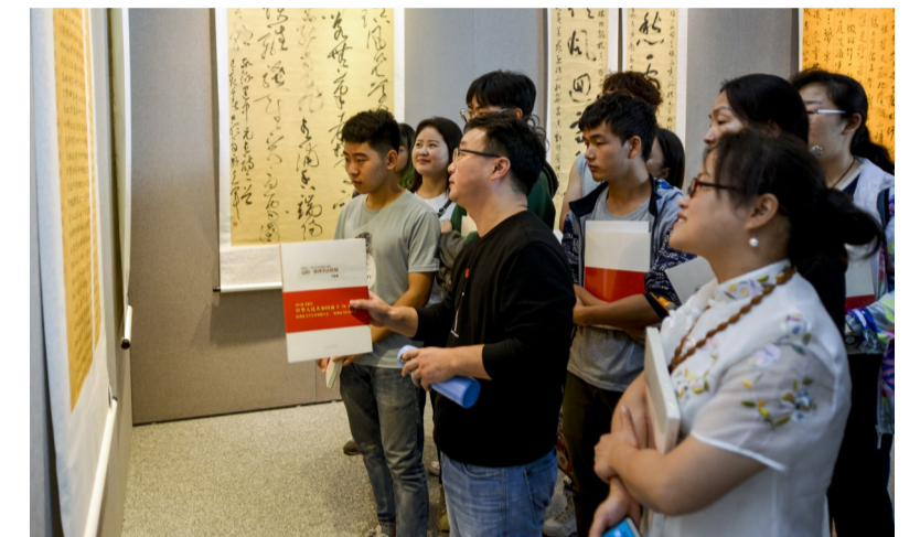
▲10月11日,株洲、益阳两地书法联展举行

本报讯(记者 肖蓉)10月11日上午,株洲、益阳两地书法作品联展在我市神农大剧院开幕,共展出200余幅精选作品。《益阳-株洲书法联展作品集》同步发行。两地文联及书法家协会相关领导和成员上百人参与了开幕式。株洲、益阳两地以传承书法、加强书艺交流、促进湖湘文化艺术发展繁荣