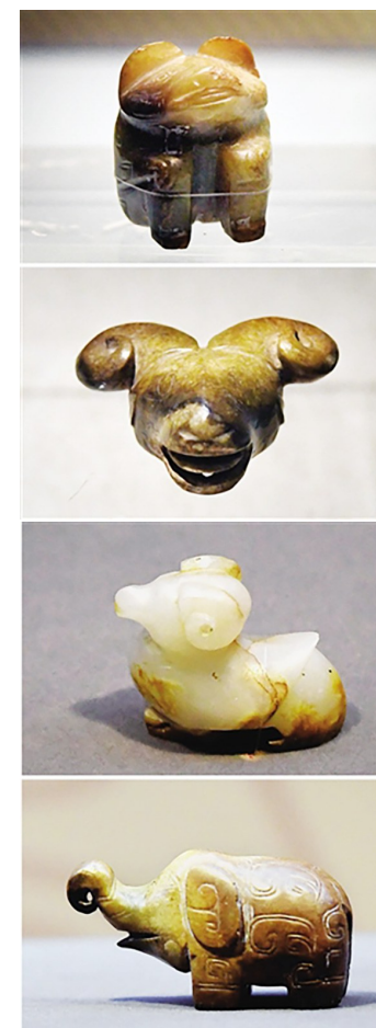
▲河南安阳妇好墓出土的玉

曾经,岫玉、蓝田玉、独山玉、绿松石、青金石等都被当做古代美玉。而这其中,来自新疆的和田玉,渐渐居于最重要的地位。