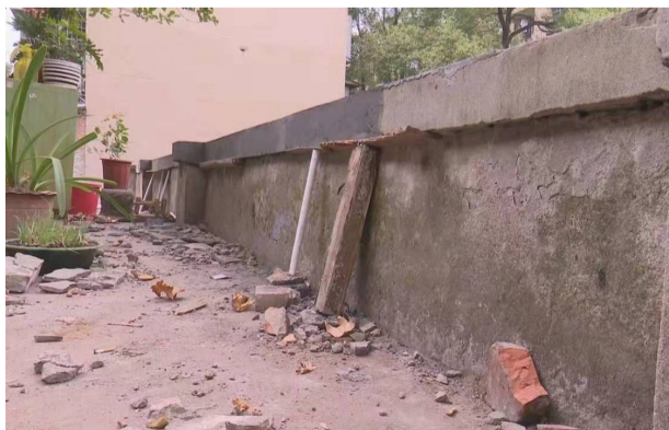
▲茨中村,快要倒的围墙已被修补