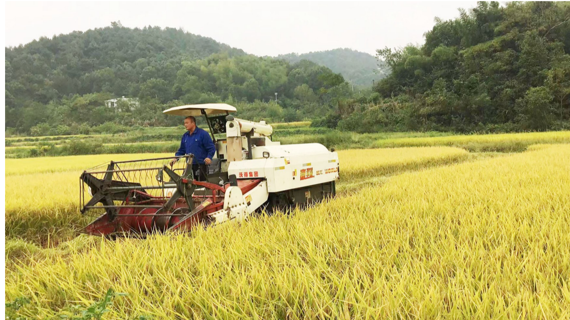
▲收割机上安装了碎草器,边收割水稻边粉碎秸秆,碎秸秆直接还田

本报讯(记者 杨凌凌 通讯员 肖斌)连日来,三门镇湖田村村民开始收割晚稻,和以往不同的是,地头田间轰鸣的收割机上安装了碎草器,边收割水稻边粉碎秸秆,碎秸秆直接还田。通过开展人居环境整治,天元区建设了两个秸秆处理转运中心,一改之前秸秆焚烧的处理方式,变废为宝。