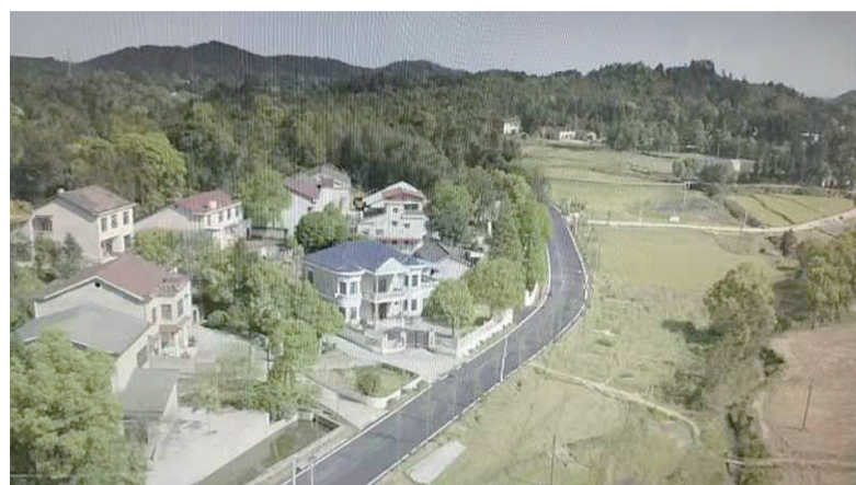
▲卦石村新貌

两个休闲农庄的步行栈道正在紧锣密鼓地建设之中。政府重点推进哪些民生实事,由人民群众说了算。今年,我市在“一区十六(乡)镇”试点开展票决制工作,进度与成效如何?10月9日召开的市十五届人大常委会第42次主任会议上,成绩单被打开。