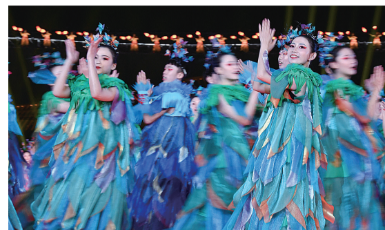
10月9日,2019年中国北京世界园艺博览会闭幕式在北京举行。图为演员在闭幕式上演出。