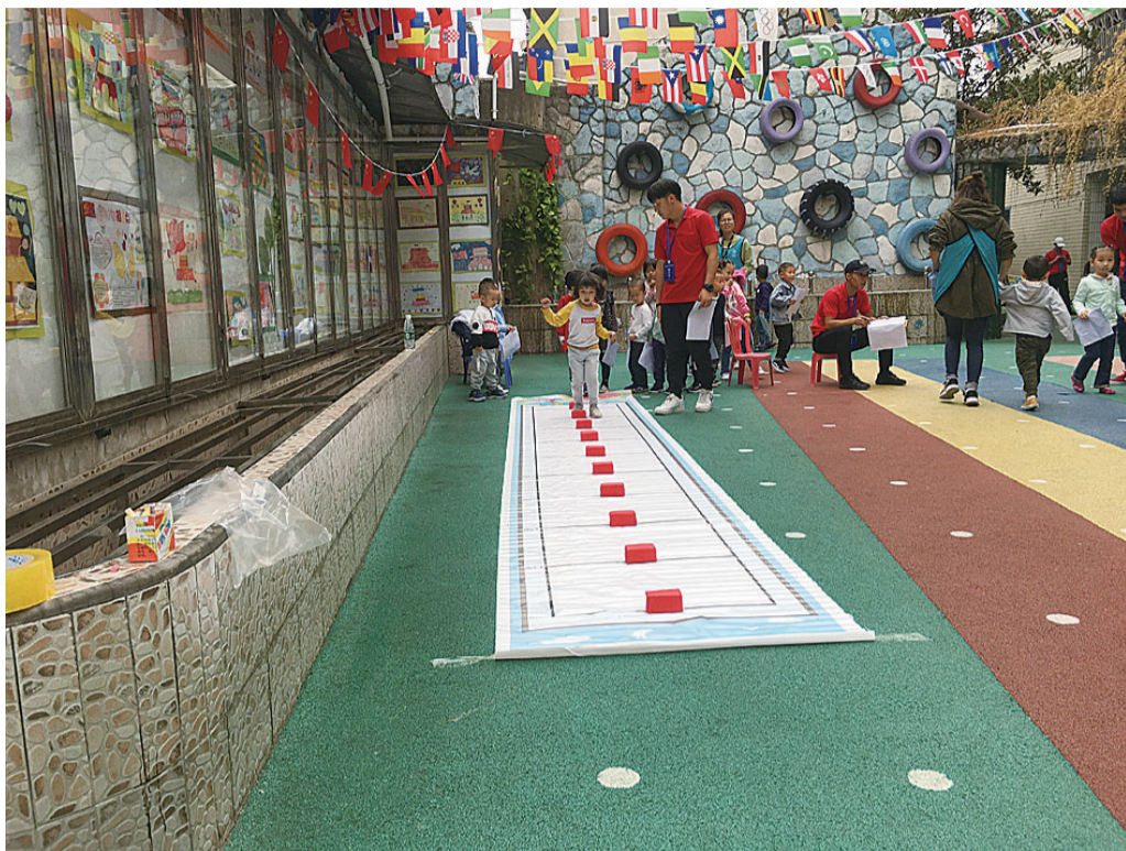
▲昨日,监测人员在幼儿园为孩子们进行体质测试

本报讯(记者 肖蓉 通讯员 周潭清)测身高、量体重、走走平衡木,看看能不能顺利过关……昨日,第五次株洲市国民体质监测正式开启,监测人员来到我市城区多家幼儿园,测试孩子们的体质。在接下来的两个月时间内,监测人员还将深入城乡多个社区、厂矿、村镇,监测搜集我市各个年龄层次的样本共5976个。